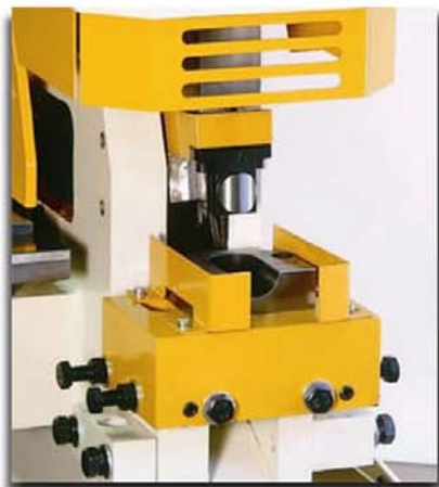
חיתוך רדיוס בקצה צינור